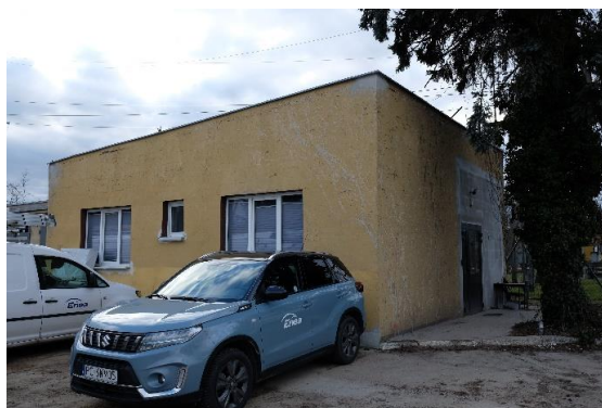
Nr 1 – Elewacja boczna i frontowa